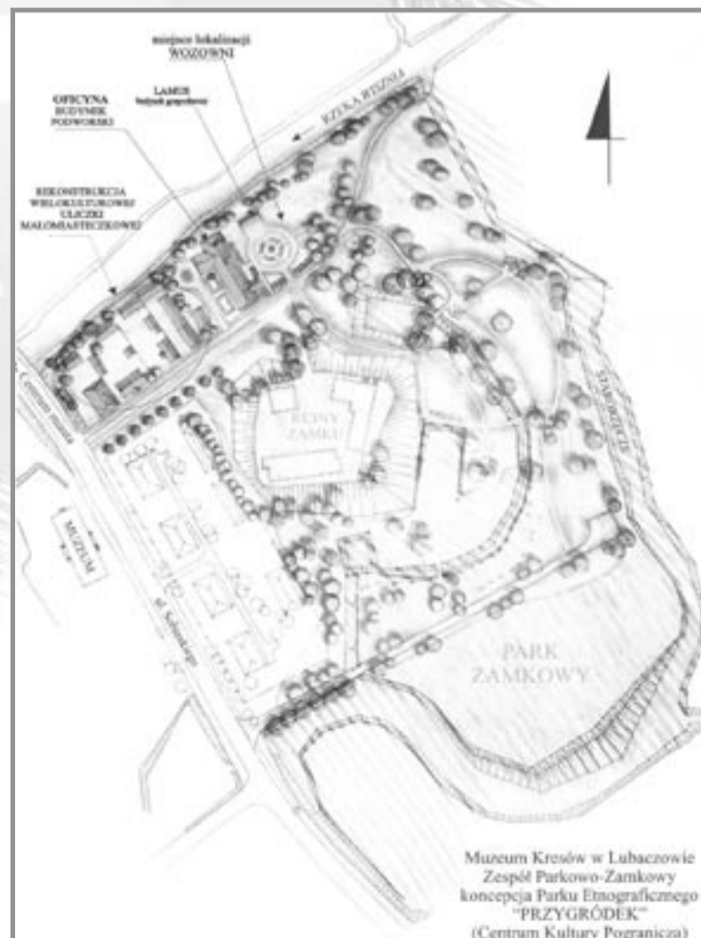
Muzeum Kresów w Lubaczowie Zespół Parkowo-Zamkowy koncepcja Parku Etnograficznego „PRZYGRÓDEK” (Centrum Kultury Pogranicza)