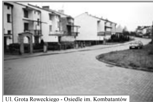
Ul. Grota Roweckiego - Osiedle im. Komendantów