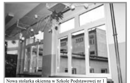
Nowa stolarka okienna w Szkole Podstawowej nr 1