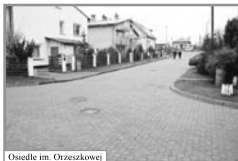
Osiedle im. Orzeszkowej