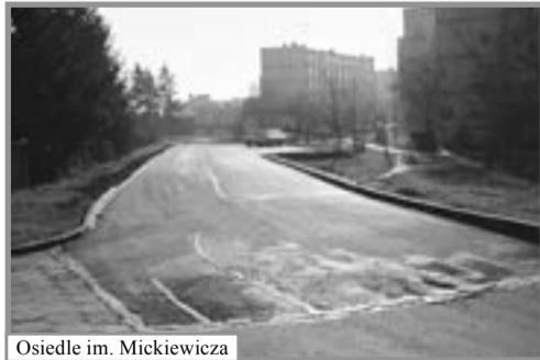
Osiedle im. Mickiewicza