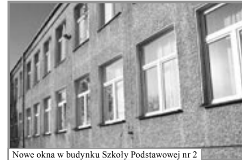
Nowe okna w budynku Szkoły Podstawowej nr 2