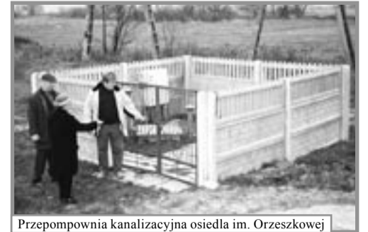
Przepompownia kanalizacyjna osiedla im. Orzeszkowej