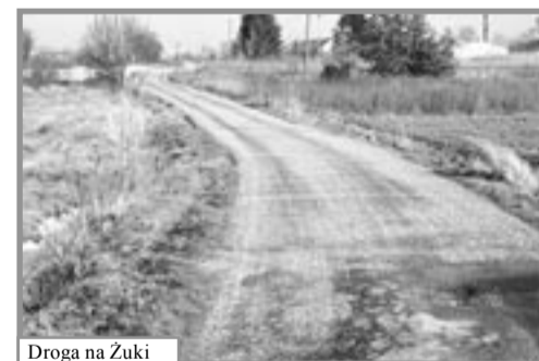
Droga na Żuki