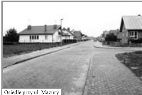
Osiedle przy ul. Mazury