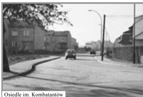
Osiedle im. Komendantów