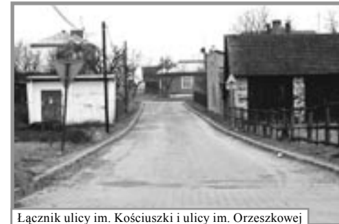
Łącznik ulicy im. Kościuszki i ulicy im. Orzeszkowej