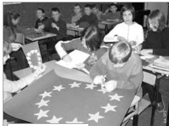
Właśnie trwa konkurs na wykonanie flagi UE