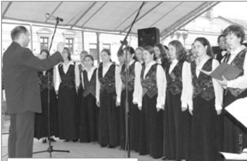
Lubaczowski chór CANZONE podczas występu w Preszowie

„Magapar”, świadczy fakt, iż po przedstawieniu „Korony” chciałam zrezygnować z drugiej sztuki - „Szukanie”, ponieważ jest przygotowywana raczej dla odbiorcy dziecięcego, a widownie w Preszowie stanowili ludzie dorośli. Wówczas profesor z Akademii Ruchu w Warszawie poprosiła w imieniu publiczności o zaprezentowanie spektaklu dziecięcego, który spotkał się z tak samo entuzjastycznym przyjęciem. Bardzo dużo osób przyszło do nas w kulisy z gratulacjami, podziękowaniami, widzowie dzielili się swoimi odczuciami, refleksjami, a najczęściej padały określenia – teatr fascynujący, bardzo sugestywny, zmuszający widza do wysiłku intelektualnego i równocześnie pozwalający wejść „duchowo” w świat magii scenicznej.