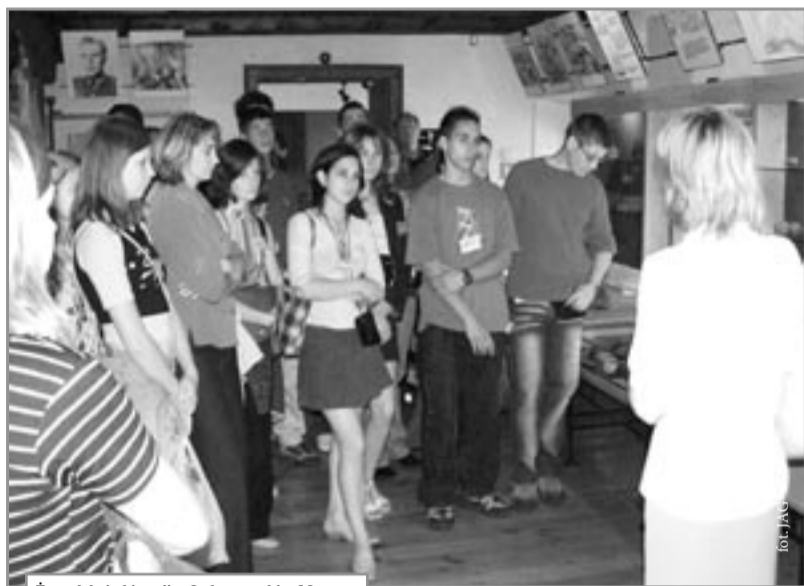
Żywa lekcja historii w Lubaczowskim Muzeum

dzynarodowa grupa młodzieży obejrzała ekspozycje lubaczowskiego Muzeum, uczestniczyła w wędrowce po Roztoczańskim Parku Narodowym podziwiając min. uroki Kobylego Jeziora i Polanki Horynieckiej, obejrzała finał