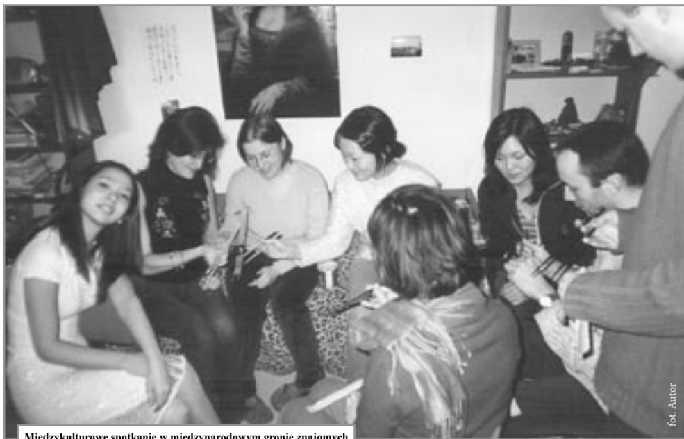
Międzykulturowe spotkanie w międzynarodowym gronie znajomych

Sam Instytut, to potężny gmach, w którym znajduje się sala kinowa, teatralna, duża biblioteka z często uzupełnianym księgozbiorem oraz licznymi czasopismami. W razie braku jakiegoś wydania można udać się do pobliskiej Biblioteki Narodowej im. Széchényiego (Országos Széchényi Könyvtár). Standardem w akademiach są pokoje dwu i trzy osobowe ze znaczną przewagą tych drugich. Są jednak nieporównywalnie większe i przestronniejsze niż polskie akademiki. Bardzo dobrze jest zorganizowane życie studenckie, istnieje silny samorząd, który działa prężnie i służy pomocą wszystkim studentom. Brał on czynny udział w organizowaniu „Dni narodów”. Polegało to na tym, że przedstawiciele każdego z krajów przy-