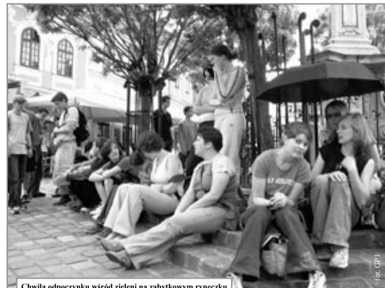
Chwila odpoczynku wśród zieleni na zabytkowym rynečku