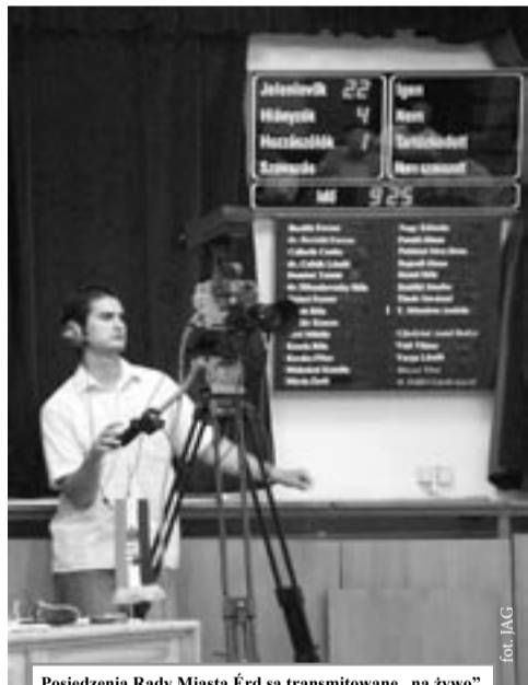
Posiedzenia Rady Miasta Érd są transmitowane „na żywo” przez lokalną telewizję

Nawiązanie kontaktów z miastem Érd nastąpiło 2 maja 2000 roku. Z inicjatywy Stowarzyszenia Rozwoju Ziemi Lubaczowskiej oraz Niezależnego Forum Prywatnego Biznesu w na-