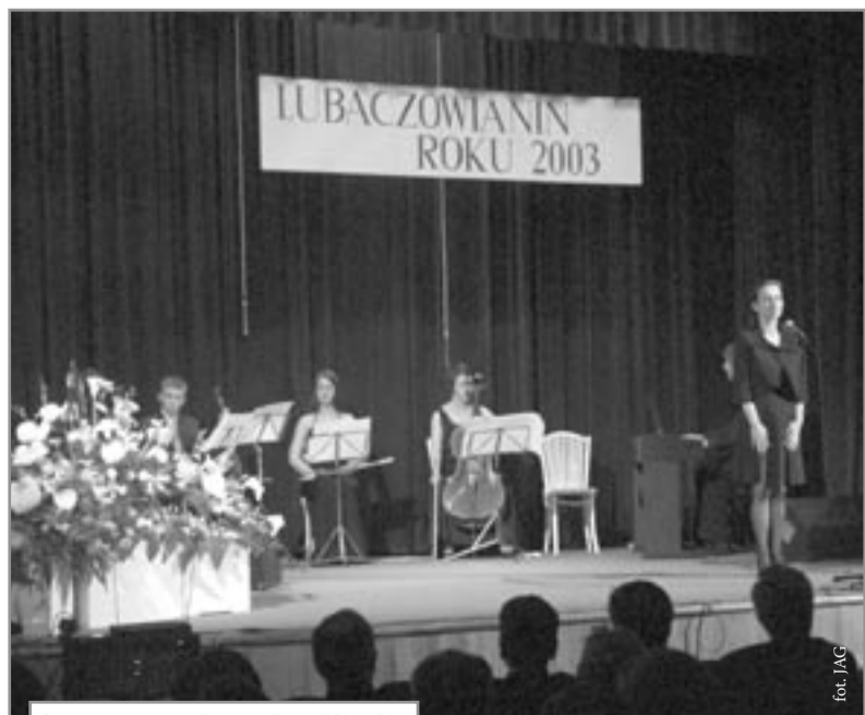
Oprawę muzyczną gali zapewnił zespół Noro Lim