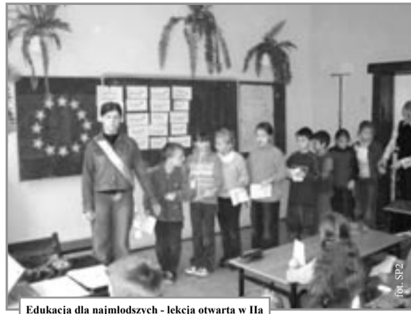
Edukacja dla najmłodszych - lekcja otwarta w IIa

Opiekunowie Klubu z nie małym zaskoczeniem i przyjemnością obserwowali, jak młodzież entuzjastycznie reagowała na propozycje