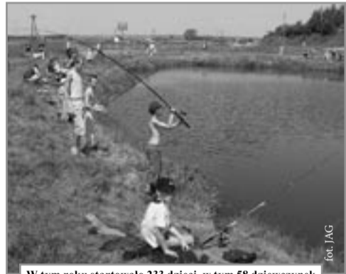
W tym roku startowało 233 dzieci, w tym 58 dziewczynek

W zabawie z wędką mogą brać udział wszystkie dzieci do lat 15, zarówno chłopcy, jak i dziewczęta, dzieci zrzeszone w PZW, jak i niezrzeszone. W trzech ostatnich latach zawody te frekwencją „biją na głowę” inne imprezy organizowane z tej okazji dla dzieci nie tylko na naszym terenie. Sądzę, że może to być najwięk-