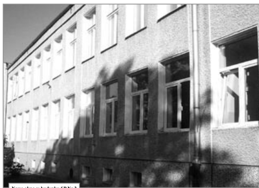
Nowe okna w budynku SP Nr 2