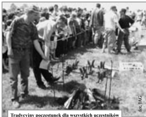
Tradycyjny poczęstunek dla wszystkich uczestników