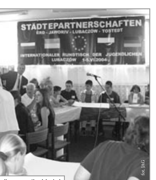
Spotkanie poświęcone systemom edukacji w poszczególnych krajach

Podczas kilkudniowych warsztatów uczestnicy projektu mogli także wymienić doświadczenia z zakresu ochrony środowiska w swoich miastach i okolicach oraz porozmaw-