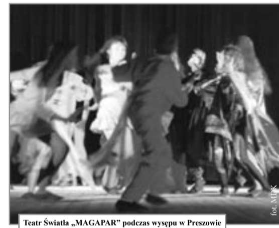
Teatr Światła „MAGAPAR” podczas występu w Preszowie