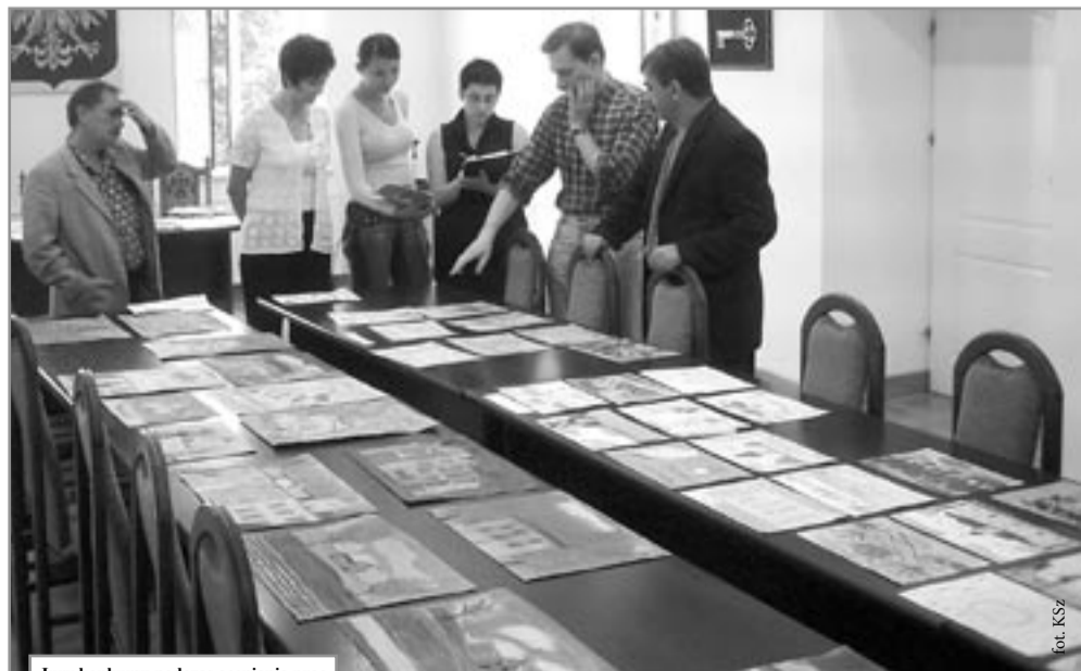
Jury konkursu podczas oceniania prac