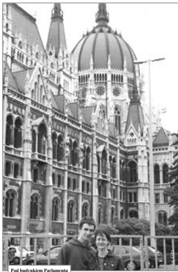
Pod budynkiem Parlamentu