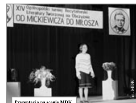
Prezentacja na scenie MDK

F estiwal „Galicja” odbywał się w dniach 13-22 czerwca 2004 roku na scenach Polski, Ukrainy i Słowacji. W Preszowie (Słowacja) wystąpiły zespoły z Lubaczowa: