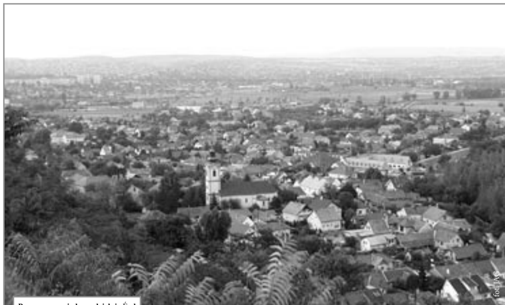
Panorama na jedną z dzielnic Érd

Po zainicjowaniu współpracy samorządowej i kulturalnej, końcem listopada 2003 roku, rozpoczęła się wymiana doświadczeń pomiędzy szkołami. Na zaproszenie Publicznego Gimnazjum Nr 1 im. mjr. Przemysława Ingłota w Lubaczowie przebywała delegacja nauczycieli z partnerskiego miasta Érd. Głównym celem wizyty było omówienie kwestii współpracy młodzieży z obu partnerskich miast w roku 2004. W nawiązaniu do tych rozmów, w maju 2004 roku, Érd odwiedziła grupa gimnazjalistów z Lubaczowa. Na przełomie kwietnia i maja 2004 roku z oficjalną wizytą na Węgrzech przebywali Burmistrzowie Miasta oraz dyrektor Miejskiego Domu Kultury i kierownik Biura Promocji i Rozwoju Lubaczowa. W tym czasie miały miejsce oficjalne spotkania delegacji partnerskich miast z Polski (Lubaczów) i Anglii (Poynton), podczas których ustalono harmonogram wspólnych przedsięwzięć Érd i Lubaczowa, jak również zasady i sposoby organizacji imprez służących utrzymaniu wzajemnych kontaktów. W trakcie trwania Dni Lubaczowa, od 28 do 31 maja 2004 roku, Lubaczów gościł węgierską delegację, która wyraziła chęć pomocy w promocji Ziemi Lubaczowskiej i Podkarpacia. Kolejne wspólne duże przedsięwzięcie, wynikające zarówno ze współpracy samorządowej, szkolnej i młodzieżowej, miało miejsce na początku czerwca. W ramach europejskiego programu - „Städ-