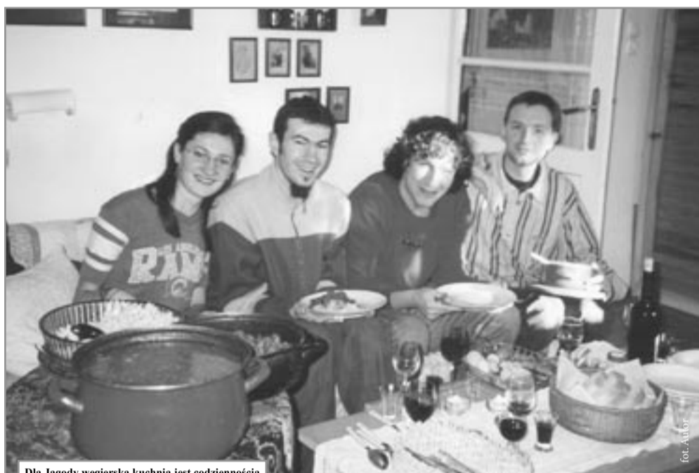
Dla Jagody węgierska kuchnia jest codziennością