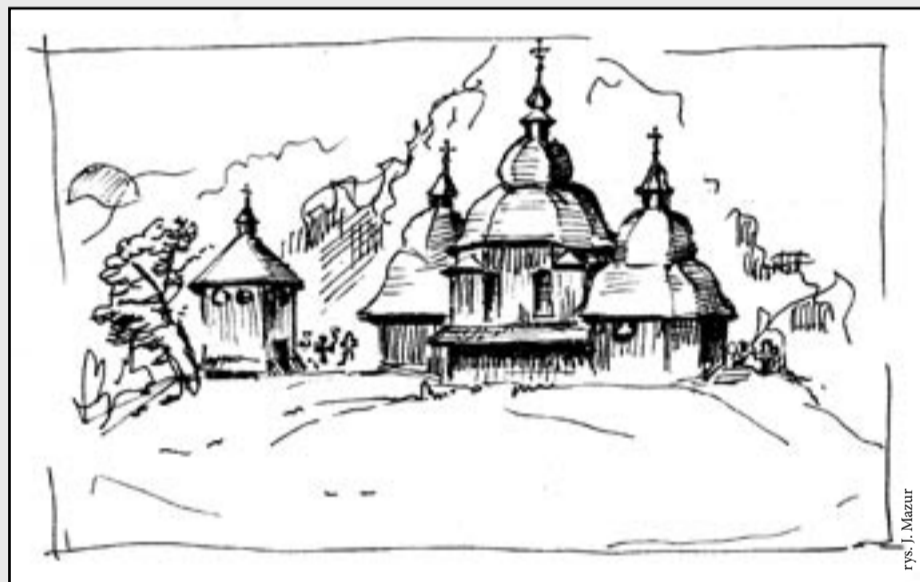
rys. J. Mazur

Nie mogąc pogodzić się ze stratą tak cennego i niepowtarzalnego zabytku wkrótce po tragicznym pożarze narodziła się inicjatywa odnowienia tej budowli. Powstał Społeczny Komitet Odbudowy Cerkwi w Opacie, który postawił sobie za cel przywrócenie cerkiewki do życia.