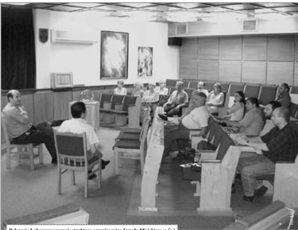
Delegacja Lubaczowa poznaje strukturę organizacyjną Urzędu Miejskiego w Érd