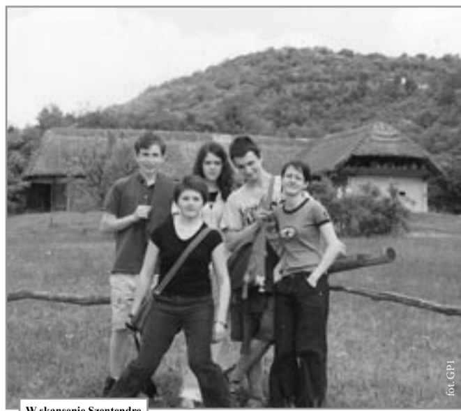
W skansenie Szentendre