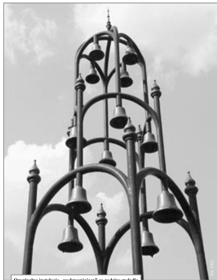
Oryginalna instalacja „wydzwanająca” co godzinę melodię

został napisany przez BPiR Lubaczowa projekt „Międzynarodowy Młodzieżowy Okrągły Stół - edukacja, środowisko, kultura”. Po wysłaniu go do Europejskiej Komisji do Spraw Edukacji i Kultury z siedzibą w Brukseli i zatwierdzeniu