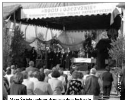
Msza Święta podczas drugiego dnia festiwalu

Idea festiwalu zrodziła się w 2000 roku, dla upamiętnienia dziesiątej rocznicy wizyty Ojca Świętego na Ziemi Lubaczowskiej. Inicjatorem muzycznego przeglądu było miejscowe Biuro Radia Maryja. Kontynuuje tę działalność Stowarzyszenie Narodowo - Patriotyczne „Rota”, przy współpracy parafii konkatedralnej w Lubaczowie.