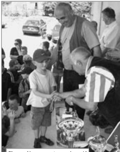
Długo oczekiwany moment wręczenia nagród

Korzystając z okazji, w imieniu własnym,