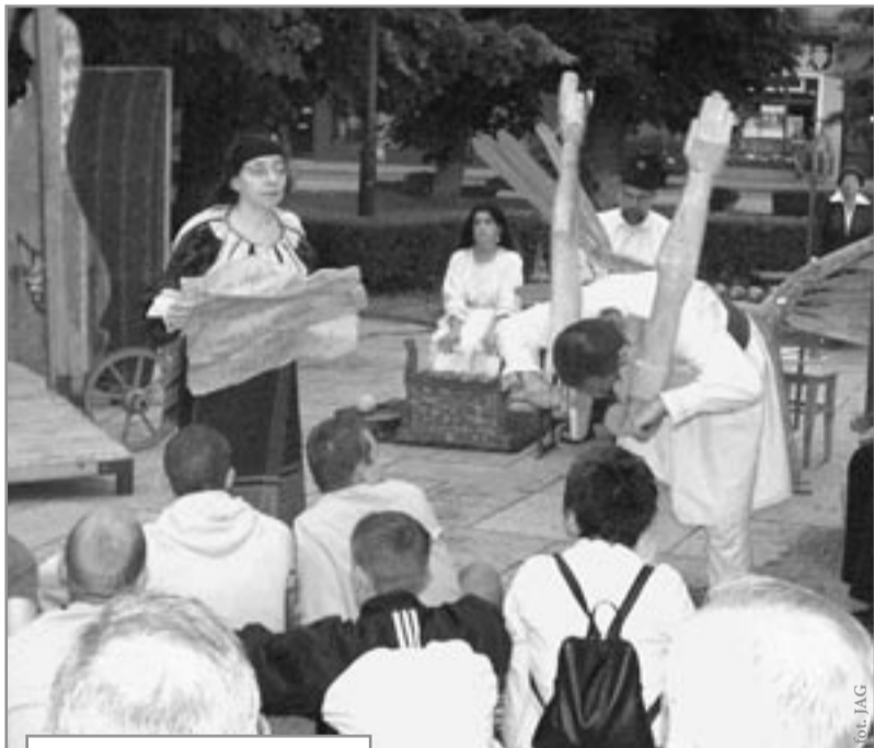
Hattyú Dal Szinhaz w lubaczowskim parku